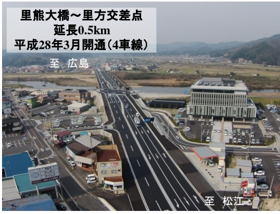
里熊大橋 広島方面を望む