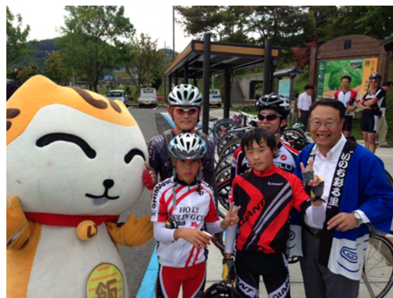
飯南町長のお出迎え