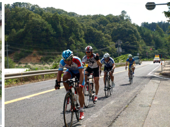
力走するサイクリスト