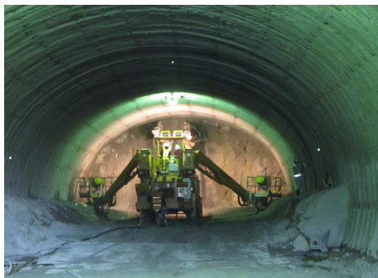
トンネル掘削状況 (平成25年11月)