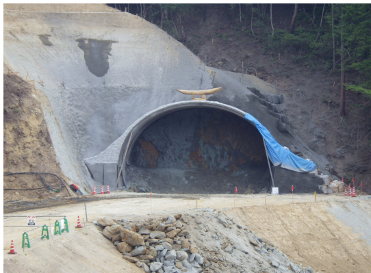
トンネル掘削開始 (平成25年6月)