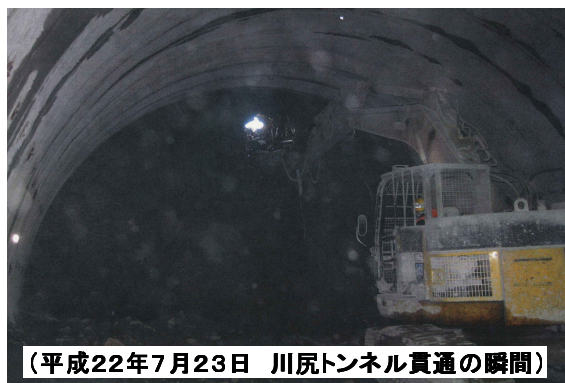
(平成22年7月23日 川尻トンネル貫通の瞬間)