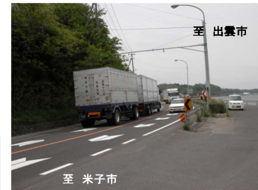
写真①急なカーブ状況 (現況の曲線半径140mを370mに改善)