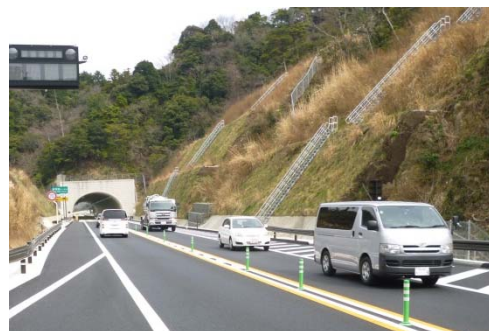
②平成27年3月17日撮影(出雲方面望む)