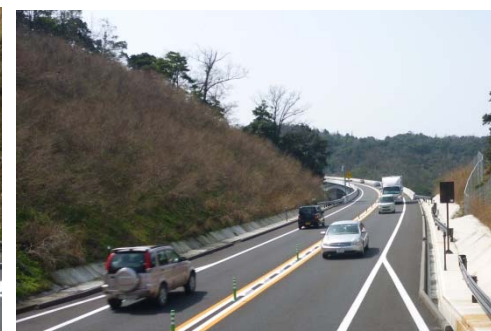
①平成27年3月21日撮影(浜田方面望む)