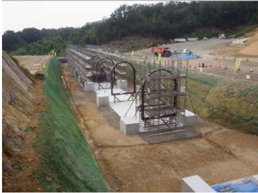
小田地区改良第8工事 施工状況