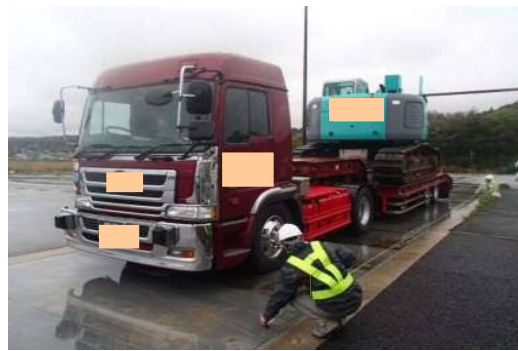
車両寸法計測状況