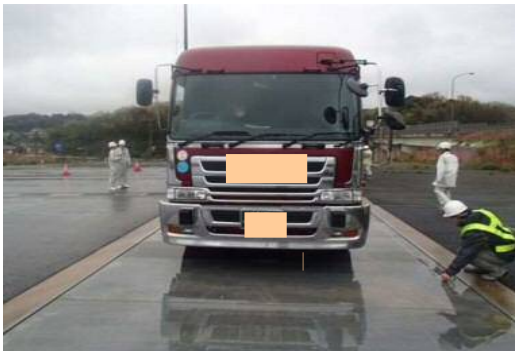
車両重量計測状況