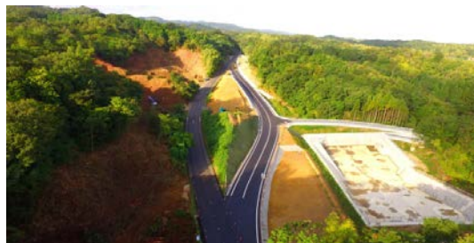
工事現場の状況(二部地区改良第5工事)