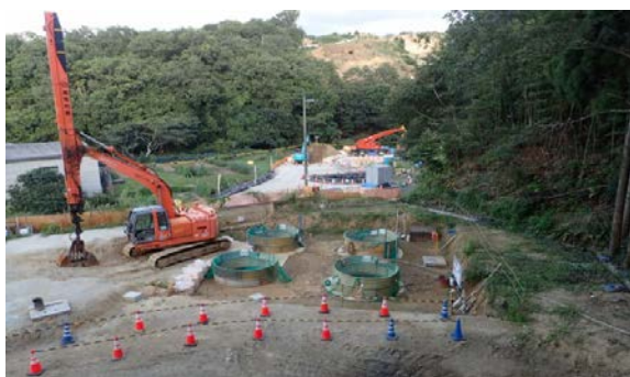
工事現場の状況(久村第2高架橋下部外工事)