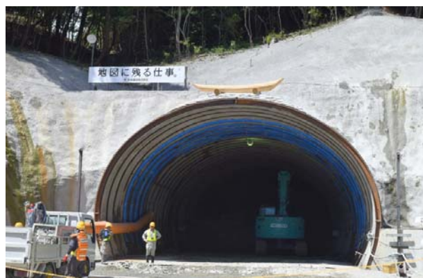
いそたけ 五十猛トンネル工事状況