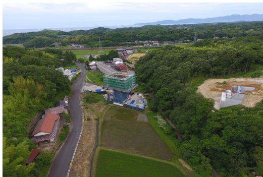
久村第2高架橋PC上部工事状況