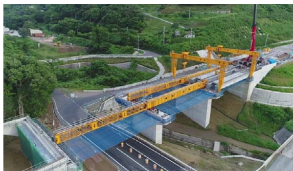
多伎PC上部工事状況