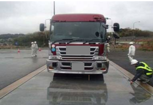
車両重量計測状況