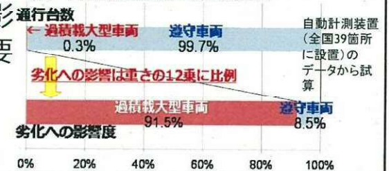
【図 道路橋の劣化に与える影響】