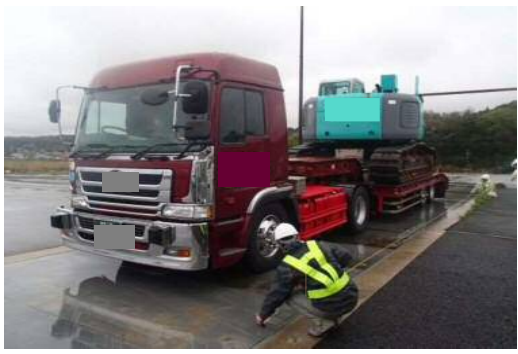
車両寸法計測状況