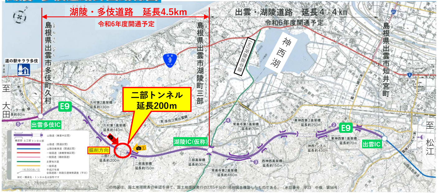
📷① 起点側坑口付近（松江市側）