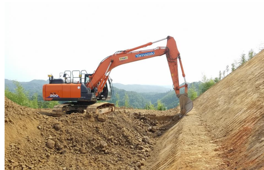
バックホウによる施工状況