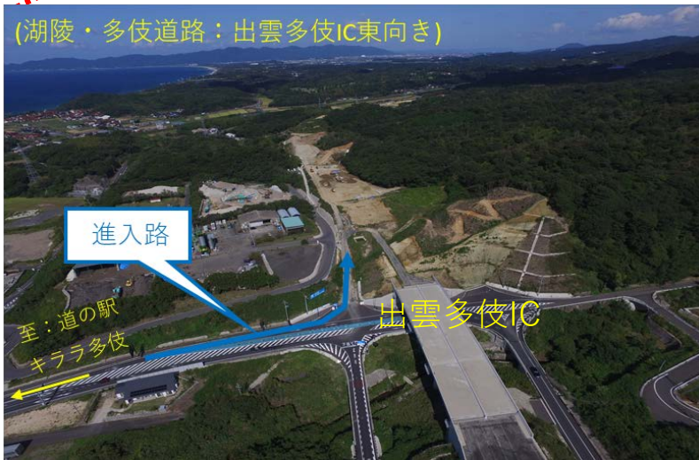
(湖陵・多伎道路：出雲多伎IC東向き)