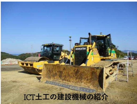
ICT土工の建設機械の紹介