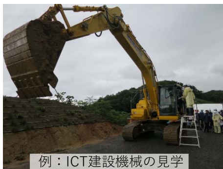
例：ICT建設機械の見学