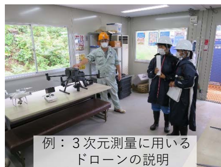
例：3次元測量に用いるドローンの説明