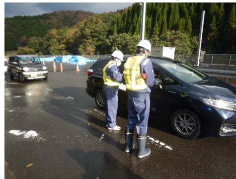
ドライバーへの呼びかけ活動