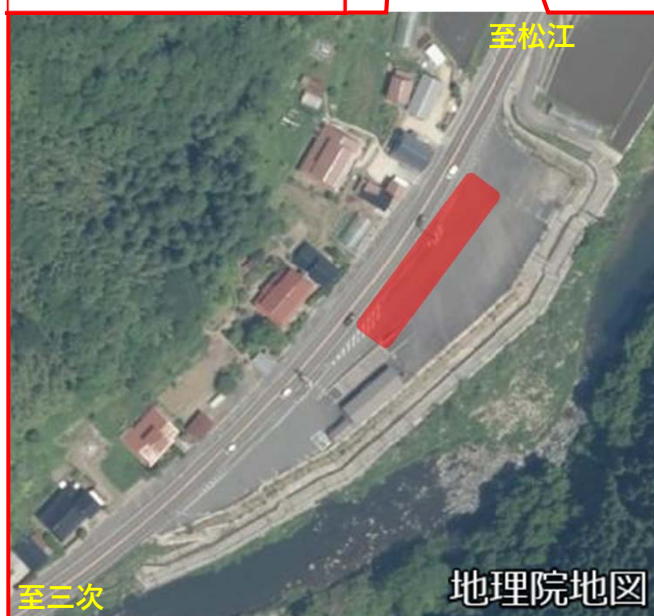
乙加宮車両監視所遠景