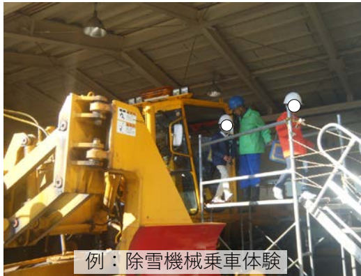
例：除雪機械乗車体験