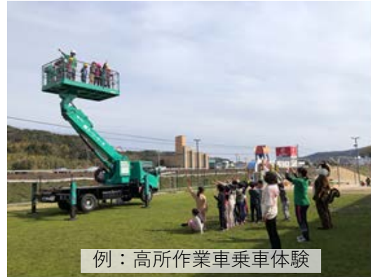
例：高所作業車乗車体験