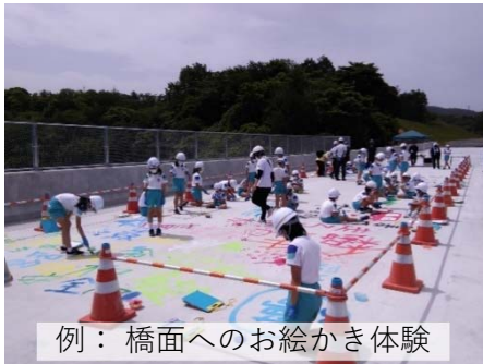
例：橋面へのお絵かき体験