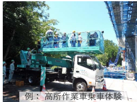
例：高所作業車乗車体験