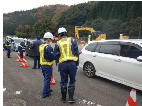
ドライバーへの呼びかけ活動