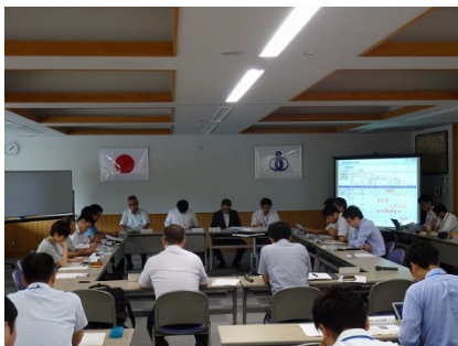
▲第3回地域実験協議会