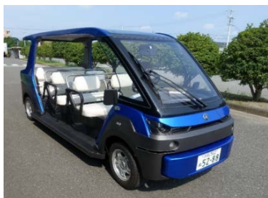
実験使用車両（電磁誘導線に沿って自動走行）

※会議は非公開とします。 ただし、報道機関に限り会議冒頭の挨拶までカメラ撮り可能です。