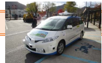
▲自動運転実証実験状況