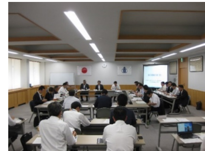
▲第2回地域実験協議会