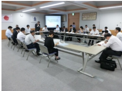
▲第1回地域実験協議会