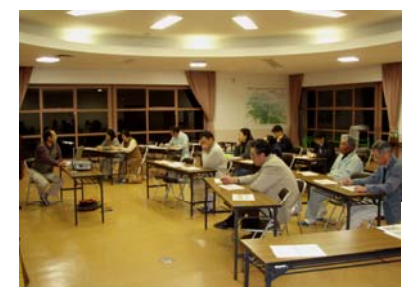
第2回 自然観察ガイド養成講座