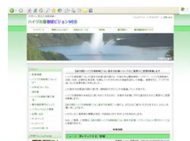
ハイヅカ湖地域ビジョンWEBのトップページ