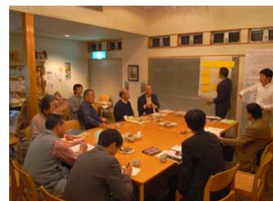
委員会設立に向けた企画会議