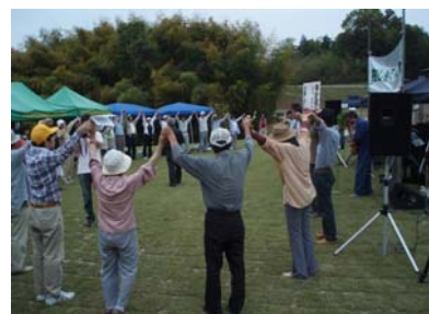
ダム記念公園でのイベント