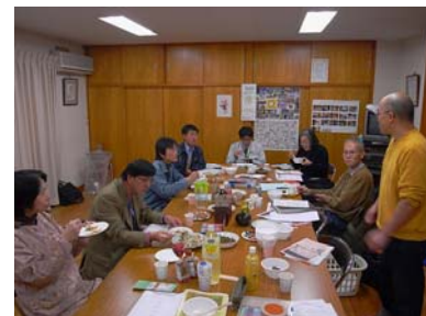
料理家を招いての試食会・企画会議