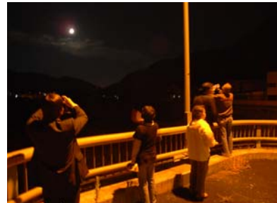
ええと湖探し ~秋のお月見会編~