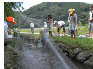
笑湖楽校第2回 ~夏休み企画~