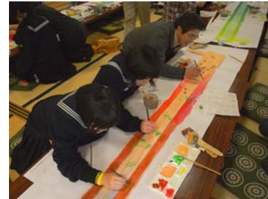
第3回WS 1:2スケール案の作成