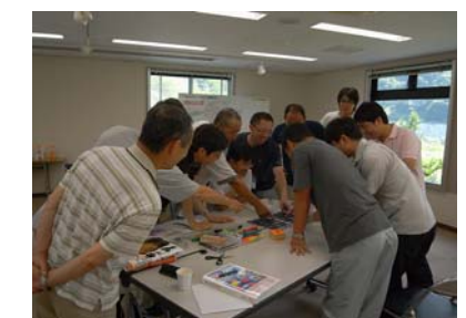
環境学習の指導者養成講座