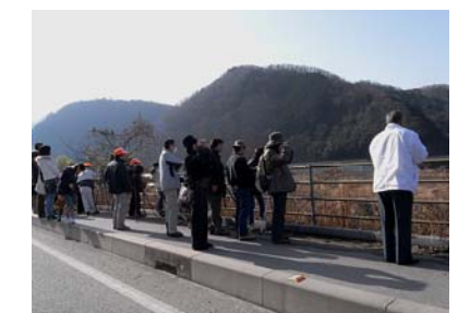
笑湖楽校第5回 ~冬鳥観察会~