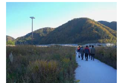
笑湖楽校第3回 ~勉強会~