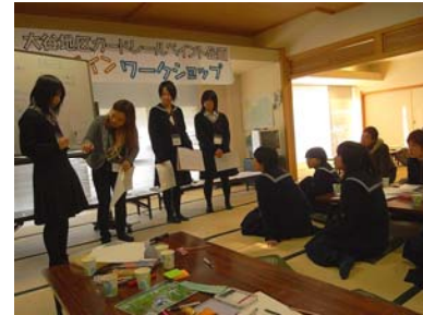
第2回WS グループ案の発表