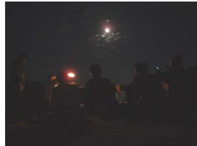
田戸岬で開いたお茶会