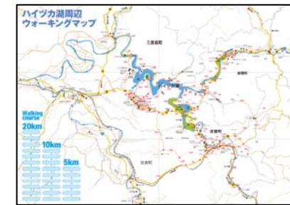
ウォーキングマップ原案(A2サイズ)