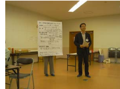
第3回合同分科会時の企画発表