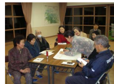
第1回 自然観察ガイド養成講座