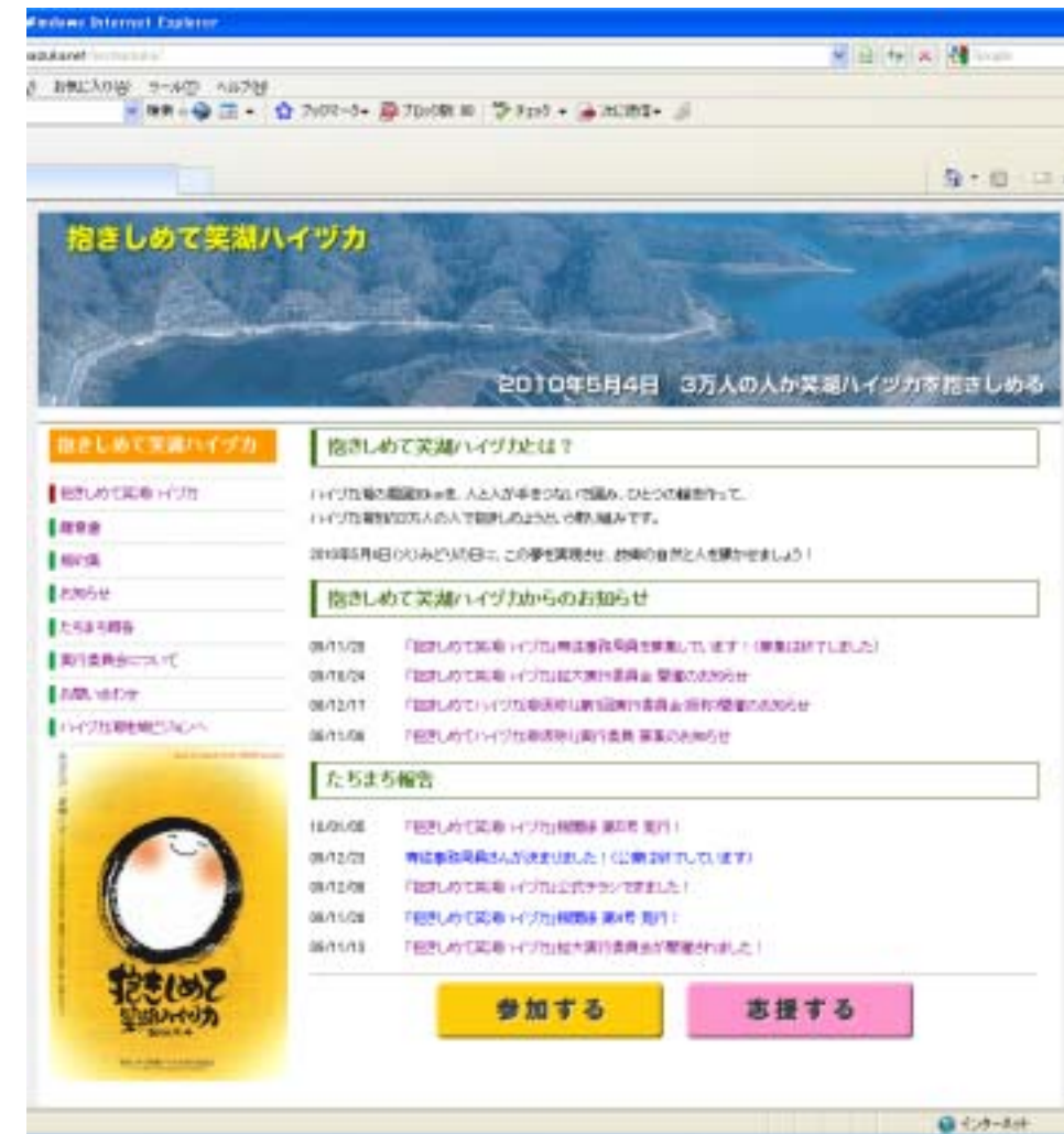
「抱きしめて笑湖ハイツカ」ブログのトップページ