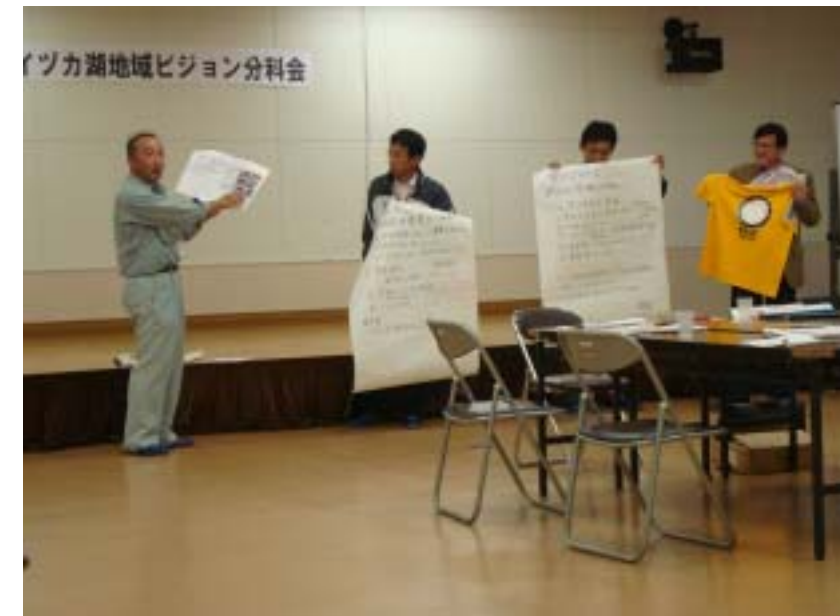
今年度の取り組み発表の様子(第3分科会)