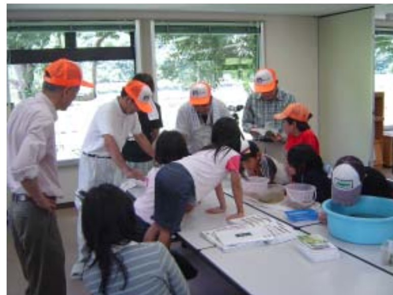
「ウェットランド笑湖楽校 第6回」 知和管理棟での活動の様子