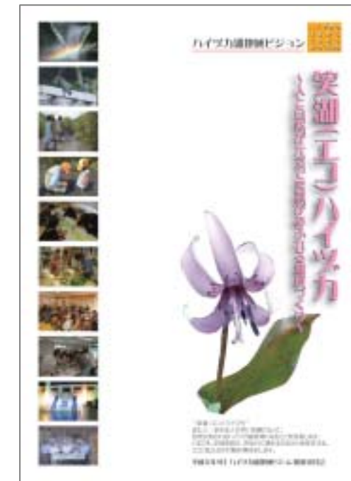
ハイツカ湖地域ビジョン(第1版)

「ハイツカ湖地域ビジョン(第1版)」は、ビジョンの取り組みの情報発信拠点である「ハイツカ湖地域ビジョンWEB」にてダウンロードすることができる。(PDF形式)