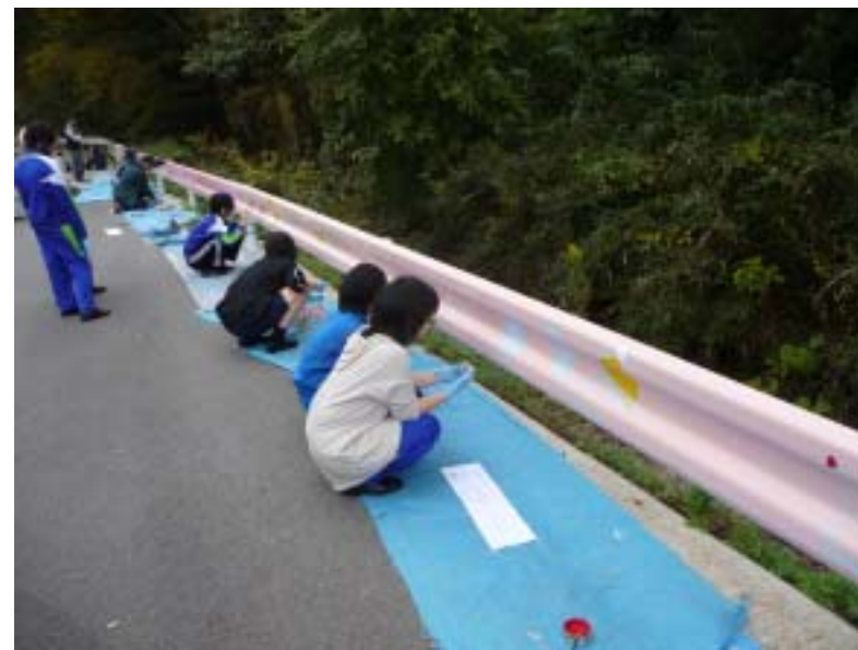
第6回大谷ガードレールWSの様子 大谷川沿いの10基(約40m)を塗装