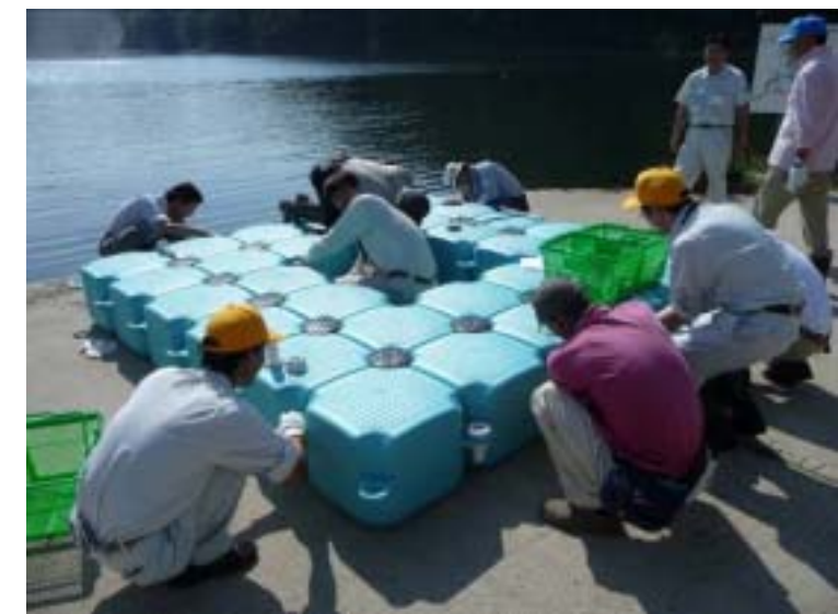
「第2回空心菜特産化委員会(仮)」 水耕栽培用フロート設置の様子