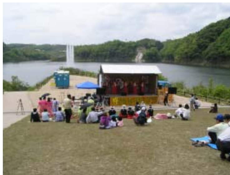
「抱きしめて笑湖ハイツカ」1年前プレイベント 市民グループによるコンサートの様子