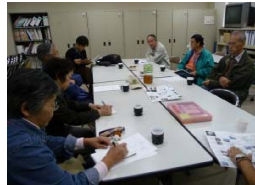
Eボート探索後の意見交換の様子