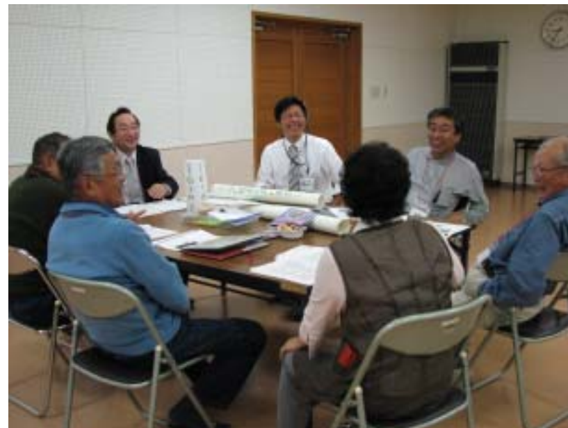
意見交換の様子(第6分科会)