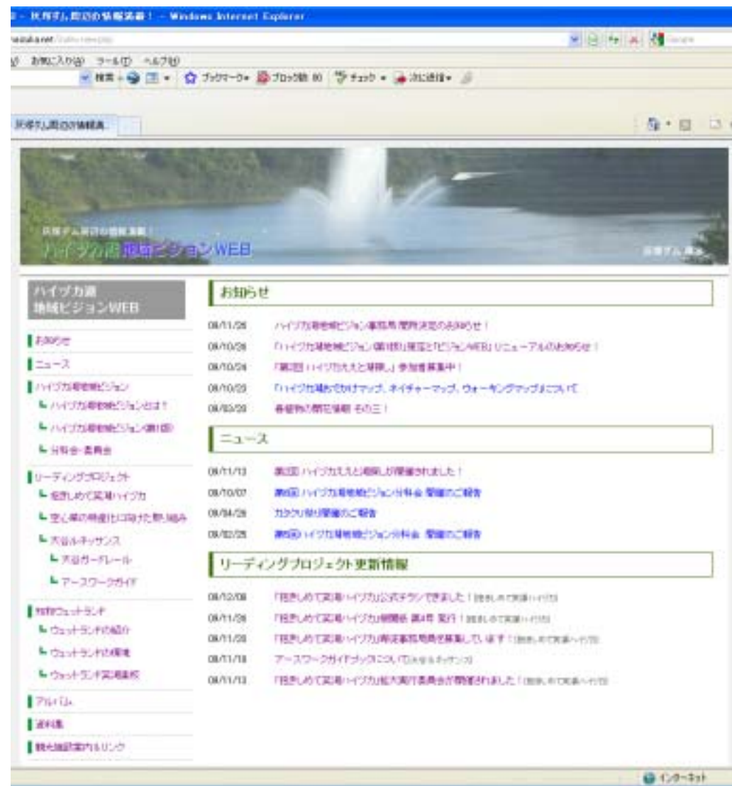
ブログとしてリニューアルされた「ハイヅカ湖地域ビジョンWEB」

・ハイヅカ湖周辺ウォーキングの楽しさについて、分科会メンバーによるブログ記事の執筆を計画している。 昨年度制作したハイヅカ湖マップ3種の修正点を地域から収集し、時点修正を行った。今後は広報活動を計画している。