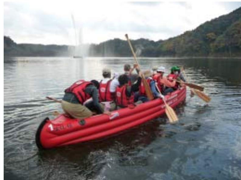
田戸岬からEボートに乗り込む様子