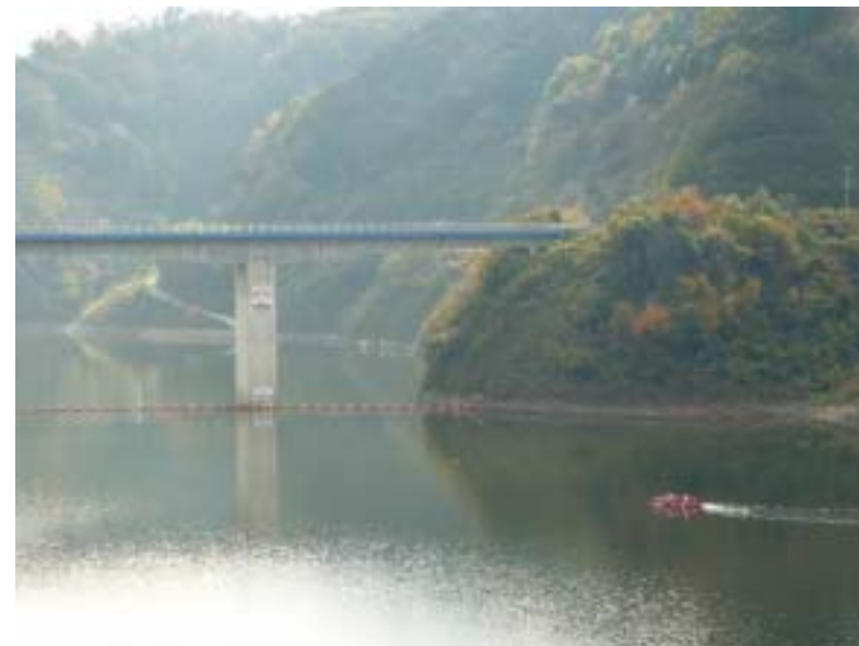
ダム湖探索の様子(灰塚大橋付近)