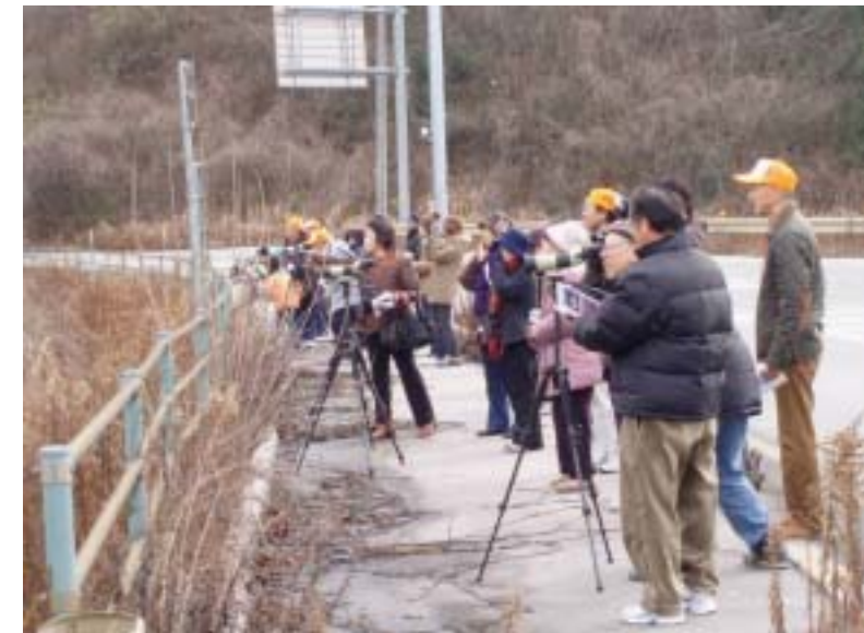
「ウェットランド笑湖楽校 第7回」 ～第3回 冬鳥観察会～の様子