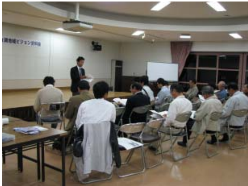
ビジョン策定の報告の様子