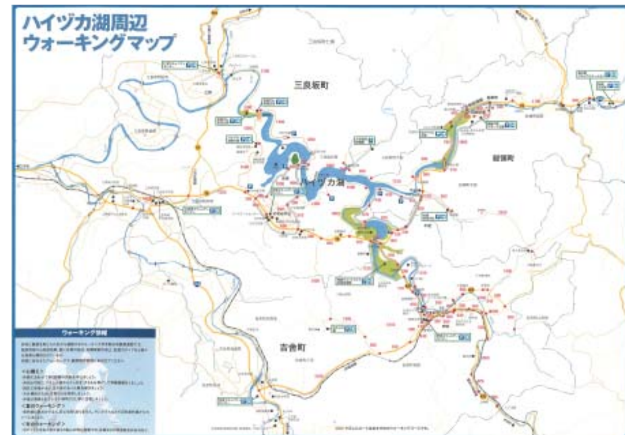
地域内の主要各地点間の距離やおすすめルートが記載された「ハイヷカ湖ウォーキングマップ」