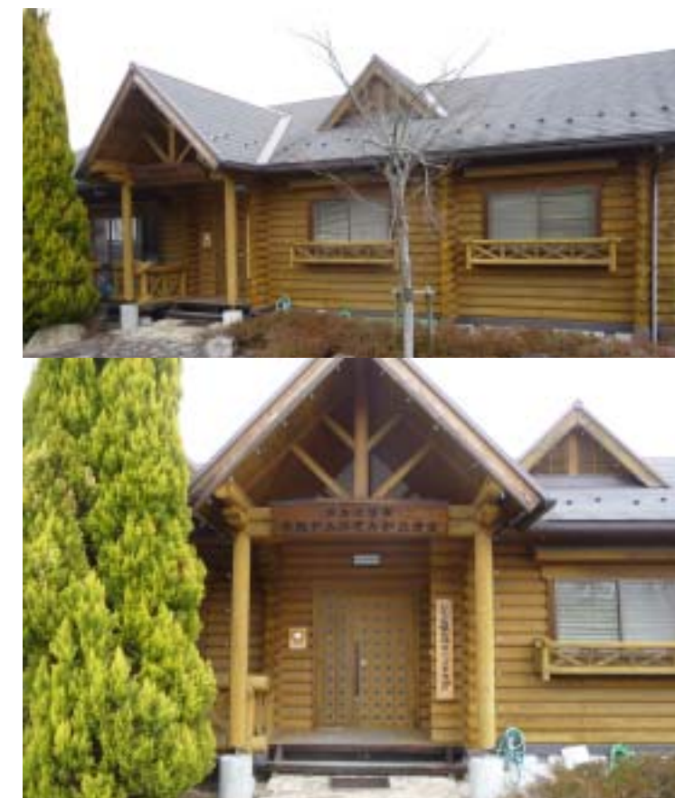
灰塚コミュニティセンター横に位置する ハイツカ湖地域ビジョン仮事務局