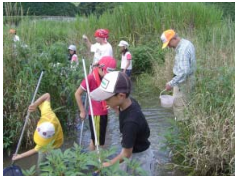
「ウェットランド笑湖楽校 第6回」 知和沼沢地での活動の様子