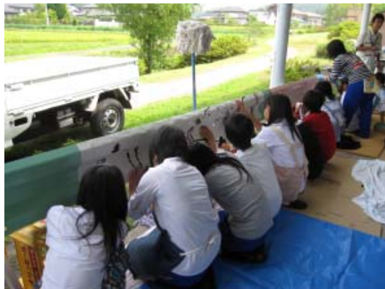
第5回大谷ガードレールWSの様子 灰塚コミセンにて試し塗りを実施