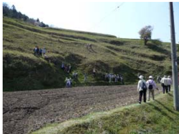
「カタクリ祭り」 カタクリ自生地を歩く様子