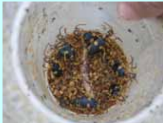
バイトトラップにより採集された、ミイデラゴミムシ。