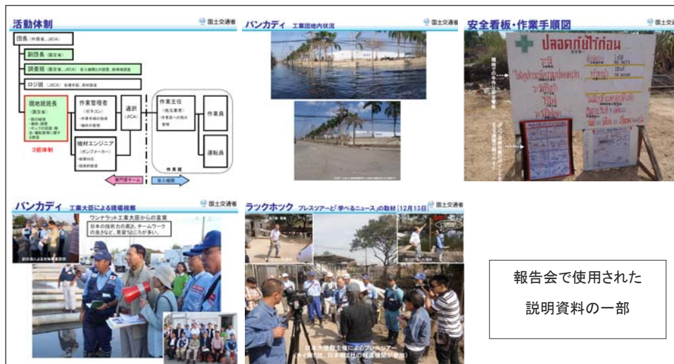
報告会で使用された説明資料の一部