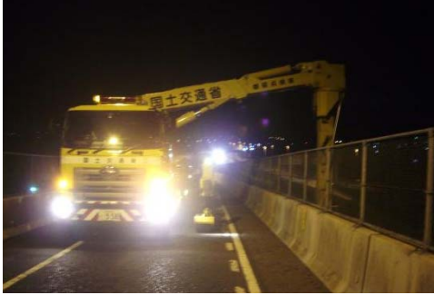
橋梁点検車による点検(1)

適切に維持管理するため、定期点検により橋梁の状態を把握します。 ※定期点検: 初回供用後2年以内、2回目以降5年に1回