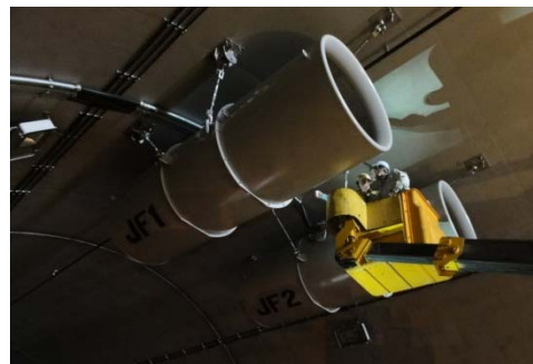
換気設備(ジェットファン)の点検