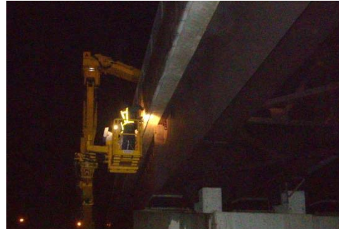
橋梁点検車による点検(2)