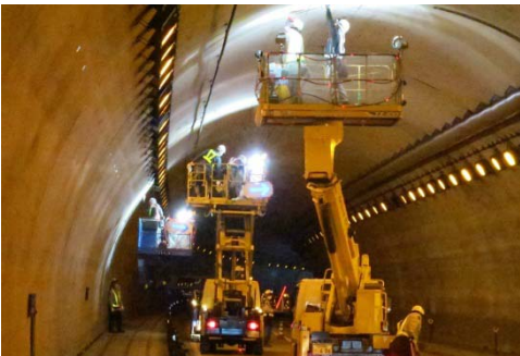
高所作業車による打音検査

適切に維持管理するため、定期点検によりトンネルの状態を把握します。 ※定期点検: 初回建設後1~2年以内、2回目以降5年に1回