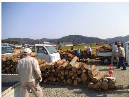
※写真は昨年の配布状況等（無料配布済）