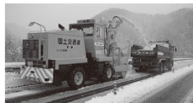
「運搬除雪」の作業状況