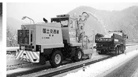
「運搬除雪」の作業状況

大雪時に通行止めを実施する場合でも、チェーン規制を実施し、タイヤチェーンを着けていれば通行できるようにすることで、これまでより、積雪による通行止め時間の短縮を目指します。