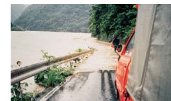
江の川の洪水による一般国道375号の浸水状況