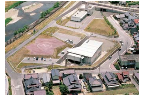
河川防災ステーション

三次市の市街地は、過去幾度となく大水害に見舞われ、水防活動の拠点が必要とされてきました。河川防災ステーションは、水防活動の拠点、地域の皆様の避難場所として利用できる施設です。同ステーション内には三次出張所、三次市防災センターも設置されており、水防のみならず、地震発生時の対応等、災害全般に対する活動をより円滑に行うことができます。