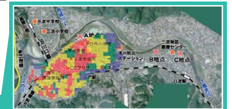
三次地域のA地点の堤防の決壊後180分の様子

洪水による浸水被害への認識を深めていただくとともに、自らの生命、財産は自らの適切な行動で守る心構え(自助)をもっていただき、もしもの際にも被害を最小限にとどめることを目的に、事務所ホームページでは、川の防災情報として、「江の川浸水想定区域図」、「重要水防箇所」、「江の川氾濫シミュレーション」を情報提供しています。