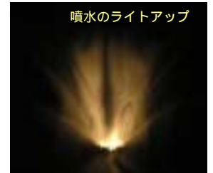
噴水のライトアップ