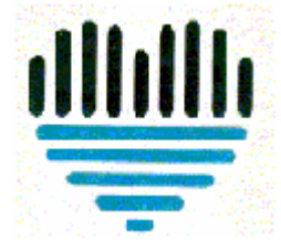
<森と湖に親しむ旬間シンボルマーク>

国民の皆さんに森と湖に親しむ機会を提供することによって、心身をリフレッシュし、明日への活力を養うとともにダムや森林等の水資源の重要性について、その関心を高め、理解を深めることを目的として、昭和62年に制定されました。この期間は、全国のダムで様々なイベント等が企画されています。