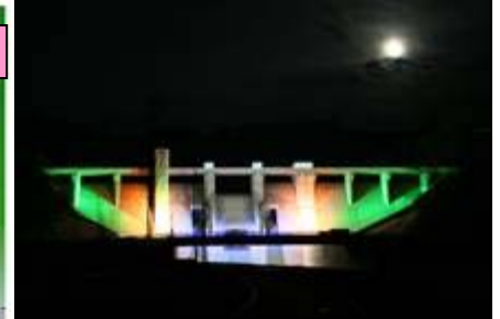
灰塚ダム堤体ライトアップ(イメージ)