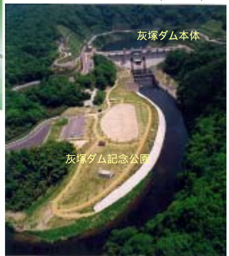
灰塚ダム記念公園