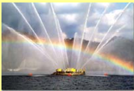
噴水のライトアップ