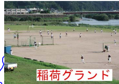
稲荷グラウンド、尾関山公園遊歩道