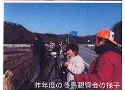
昨年度の冬鳥観察会の様子