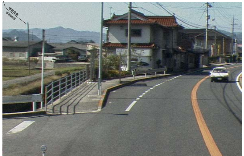
馬橋バス停と花壇