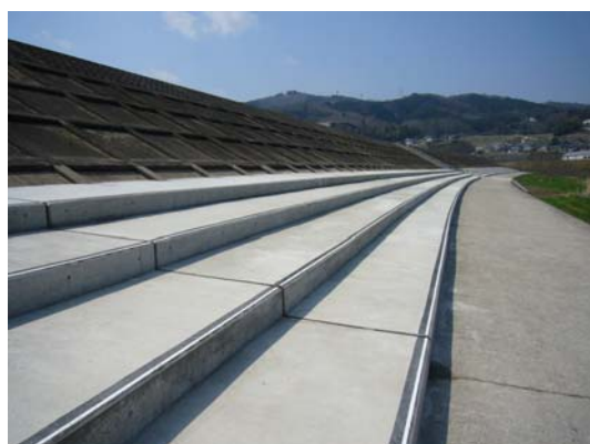
管理用階段の整備状況