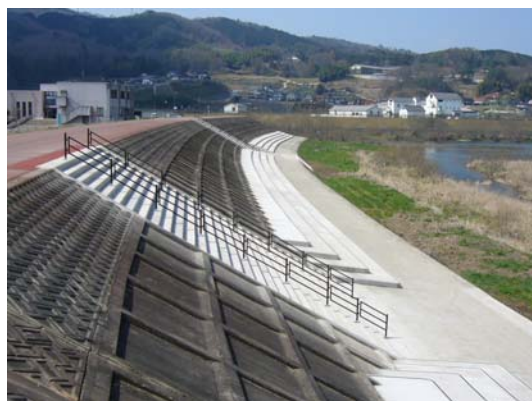
階段状護岸の整備状況