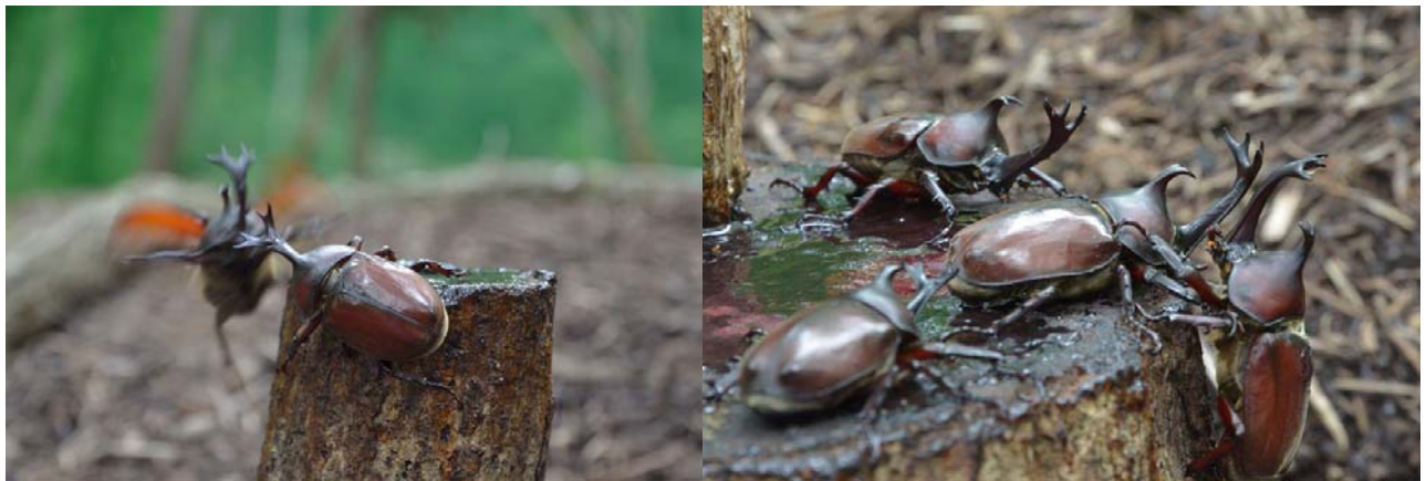
6月23日現在、成虫は約80匹発生しています。写真：6月23日撮影