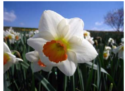
フレグラントローズ(白)