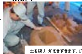
土を練り、炉をきずきます。炉が築けると火入れ当日の早朝まで薪を燃やし炉を乾燥させます。火入れ式は5月13日午前1時です。