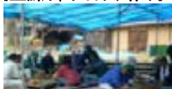
築炉用の粘土を練りブロックを作ります。炉に使用する土は操業の成否を決める重要な役目を果たします。