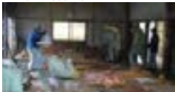
薪を焚き、地面を乾燥させると共に、生木の棒(しなえ)や掛矢を使っておきを粉炭状になるまで叩く作業です。