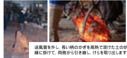
送風管を外し、長い柄のかぎを高熱で溶けた土の炉内縁に掛けて、両側から引き崩し、けらを取り出します。