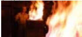
炉に砂鉄と木炭を交互に入れ、「ふいご」で風を送り砂鉄を溶かします。ふいごには、「足踏みふいご」と「手押しふいご」があります。