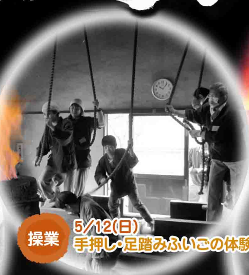
5/12(日) 操業 手押し・足踏みふいこの体験