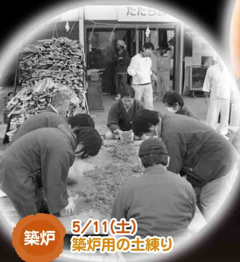
5/11(土) 築炉 築炉用の土練り