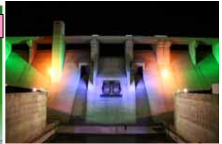
灰塚ダム堤体ライトアップ