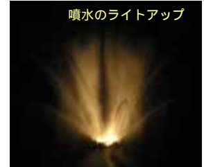
噴水のライトアップ