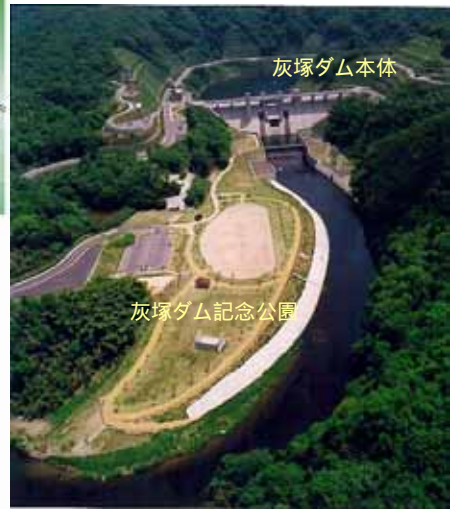
灰塚ダム記念公園