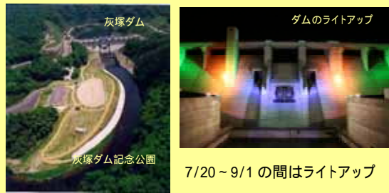
7/20～9/1の間はライトアップ