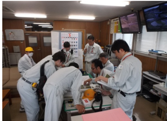
H26.5 点検報告及び補修検討状況