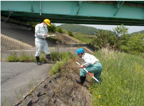
H26.5 出水期前の堤防点検状況

点検結果は、今後の維持・修繕等河川管理の資料として使用します。補修等の必要な箇所は事務所で取りまとめ、速やかに補修対応を実施します。