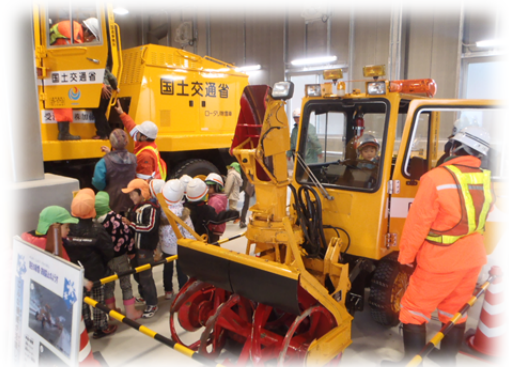
昨年のふれあい体験（松江自動車道）