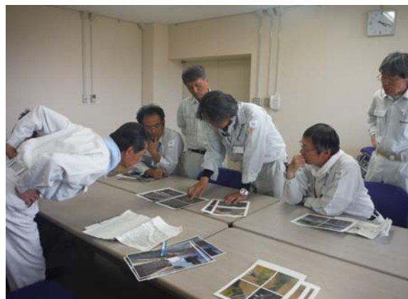
点検報告及び補修検討状況(H27.5)