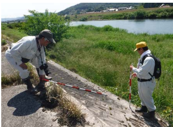
出水期前の堤防点検状況(H27.5)

点検結果は、今後の維持・修繕等河川管理の資料として使用します。補修等が必要な箇所は事務所で取りまとめ、速やかに補修対応を実施します。