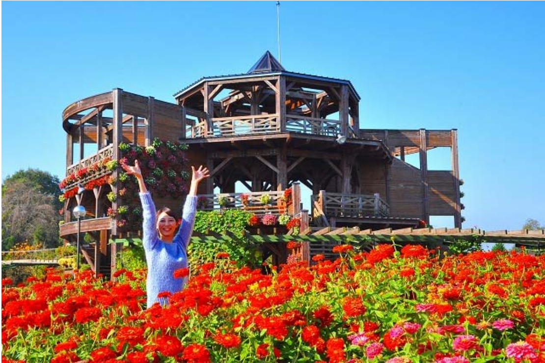
※昨年の「ジニア畑」の様子

ジニア（百日草）は、メキシコを中心に南北アメリカに 15 種類ほどが分布する植物です。初夏から晩秋にかけての長い期間花が咲き続けることから「百日草（ヒャクニチソウ）」とも呼ばれています。