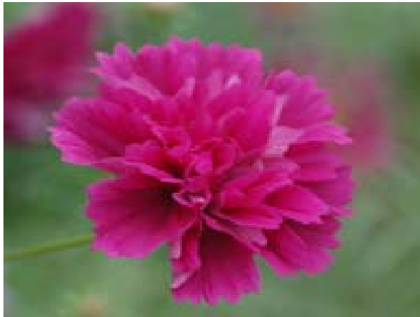
【変わり咲き（新品種）】 ダブルカーネーション