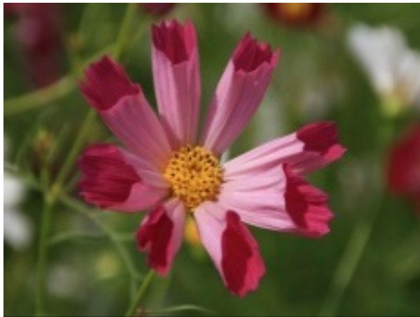
【変わり咲き】 シーシェル

※花筒状になる独自花です。花弁の形状から「貝咲きコスモス (sea shell)」ともいられています。