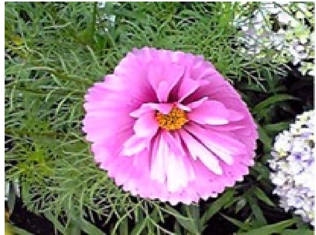
【変わり咲き（新品種）】 カップケーキミックス