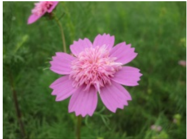
【変わり咲き】 丁子咲き

※花筒状になる独自花です。花弁の形状から「貝咲きコスモス (sea shell)」ともいられています。