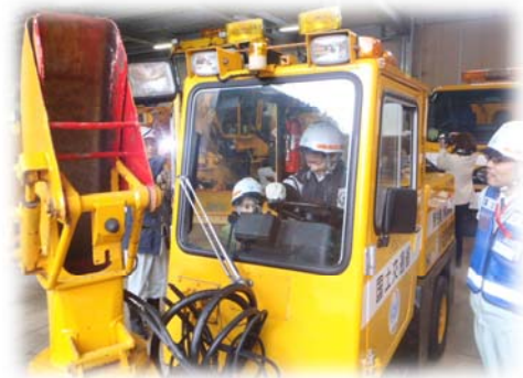
昨年 の ふれあい体験（布野除雪基地）