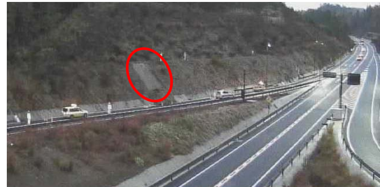
写真: 法面崩落状況