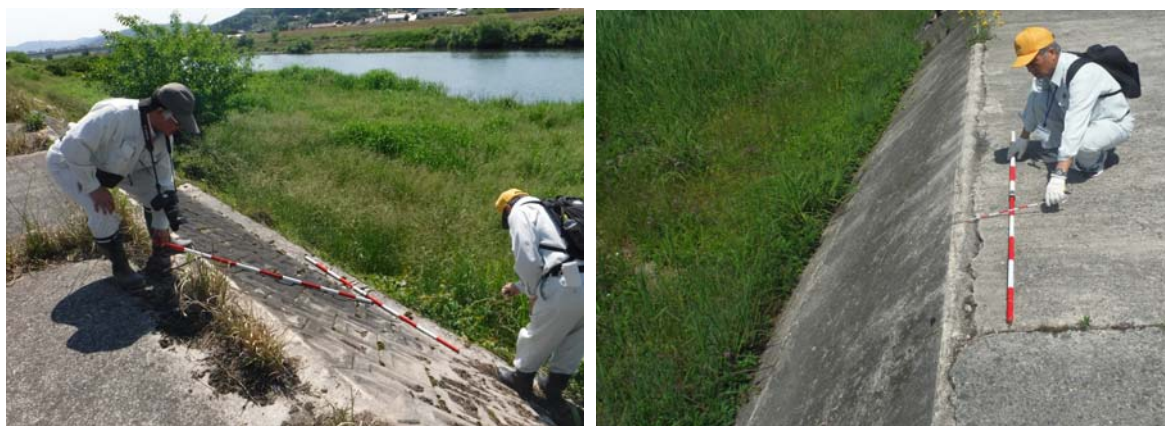
出水期前の堤防点検状況(昨年度)

点検結果は、今後の維持・修繕等河川管理の資料として使用します。補修等の必要な箇所は事務所で取りまとめ、速やかに補修対応を実施します。