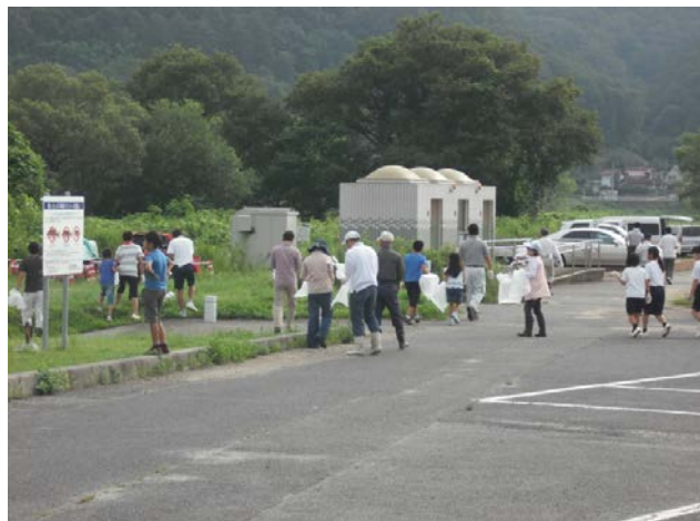
（清掃作業（鶴飼い乗船場付近））