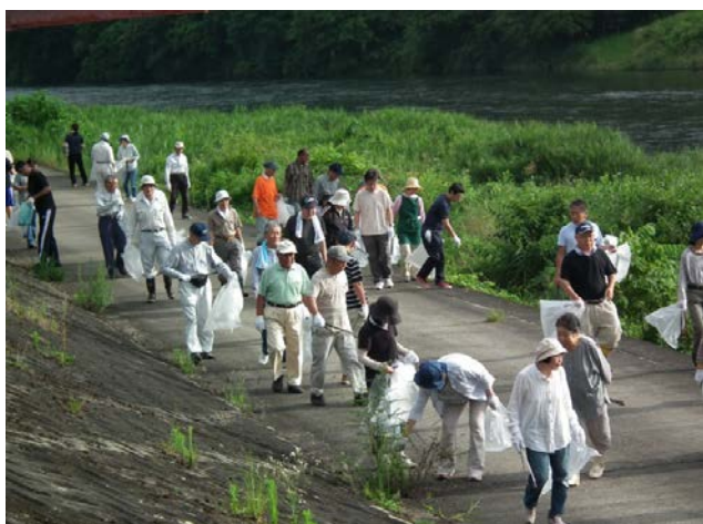
（清掃作業（旭橋付近））