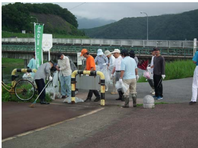
（清掃作業（祝橋付近））