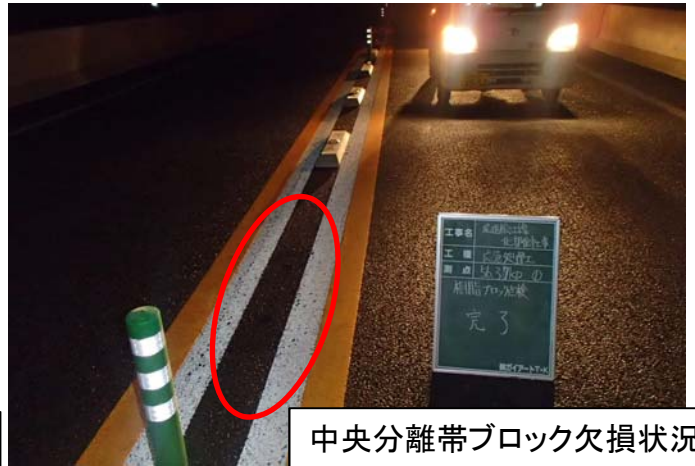
中央分離帯ブロック欠損状況