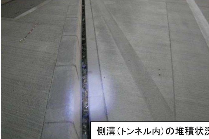
側溝(トンネル内)の堆積状況