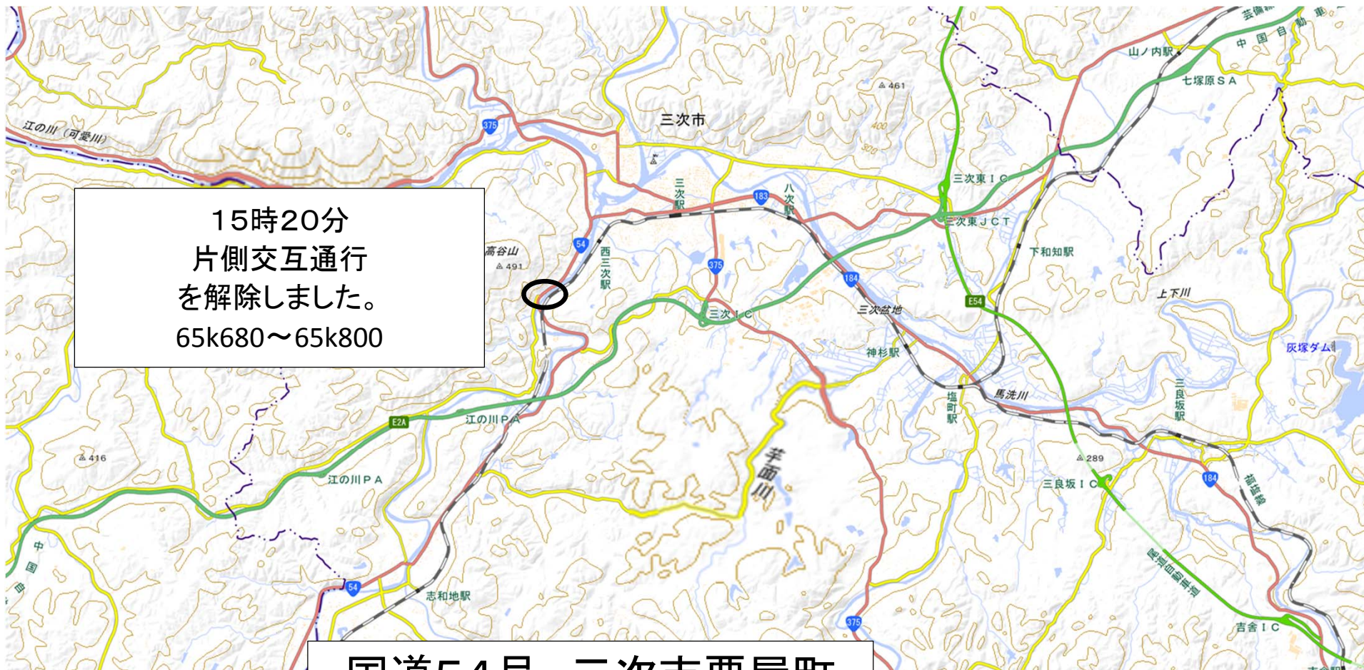
国道54号 三次市栗屋町