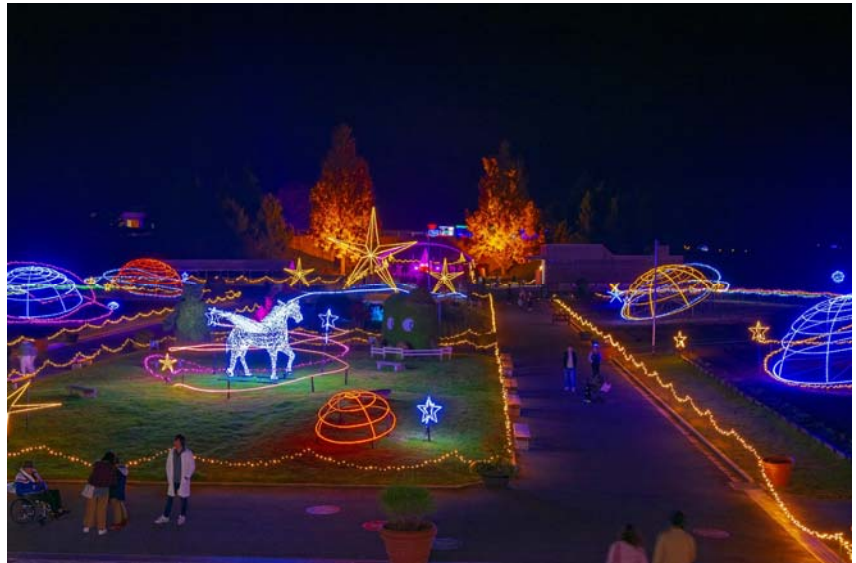
上段写真 場所：中の広場 下段写真 場所：ひばの里